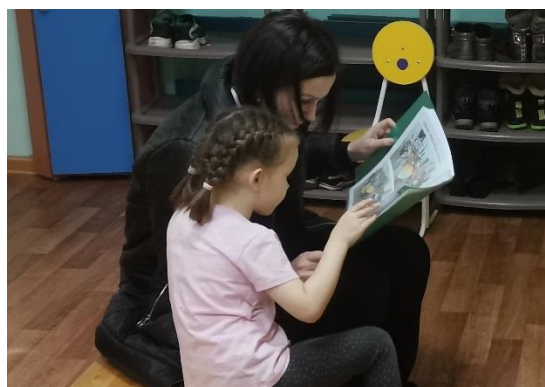
Рисунок 1 – размещение инженерных книг в приёмной Рисунок 2 - совместный просмотр инженерных книг с родителями