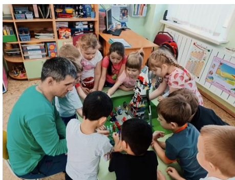
Рисунок 11 – конструирование ракеты с папой одного из воспитанников