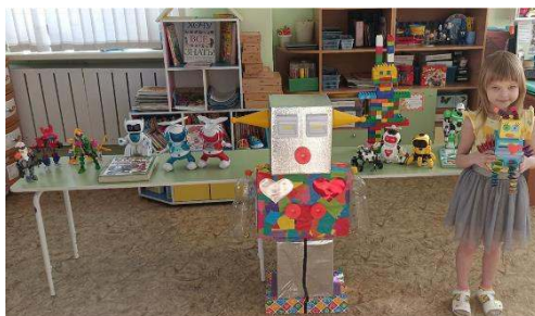
Рисунок 12 – выставка "Мир роботов"

Регулярно организуем тематические выставки детского технического творчества, где представляем не только продукты совместной творческой деятельности, но и информационно-просветительские материалы, направленные на обогащение знаний родителей.