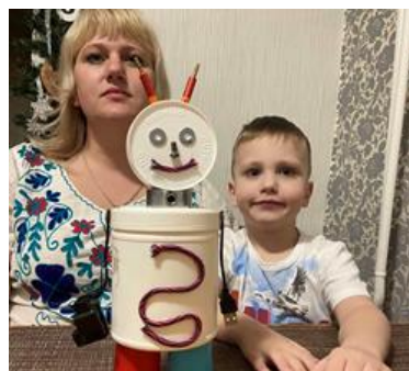
Рисунок 5, 6 – конструирование роботов дома