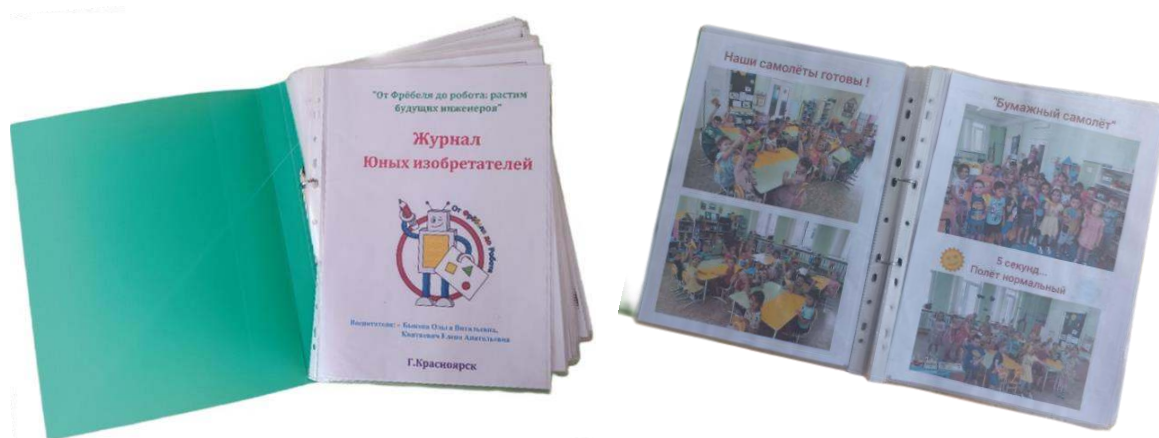
Рисунок 3, 4 – внешний вид "Журнала Юных изобретателей"

Одним из обязательных этапов реализации программы является фотографирование продуктов детской деятельности. В группе скопилось много цветных фотографий, что стало основой журнала для родителей. И постепенно в процессе деятельности, при реализации проектов у нас стали сложиться новые формы и приёмы работы. Итогом общей работы стал "Журнал юных изобретателей" для родителей. Это сборник наглядных материалов по конструированию, в котором отражены этапы реализации парциальной программы «От Фрёбеля до робота: растим будущих инженеров», процесс изготовления и продуктов детской деятельности, а также совместная работа с родителями по обмену опытом.