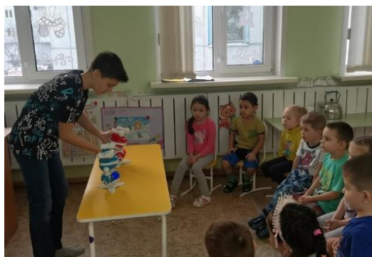
Рисунок 13 – презентация и знакомство с танцующими роботами

Вышеперечисленные формы прослеживаются в наших совместных проектах. Например, в процессе реализации проекта "Мир роботов" старший брат воспитанника предложил представить презентацию "Что умеют роботы?" и познакомил с танцующими и говорящими роботами. В проекте "Летательные аппараты" к нам на помощь пришел папа и помог сконструировать совместно с детьми ракету и квадрокоптер.