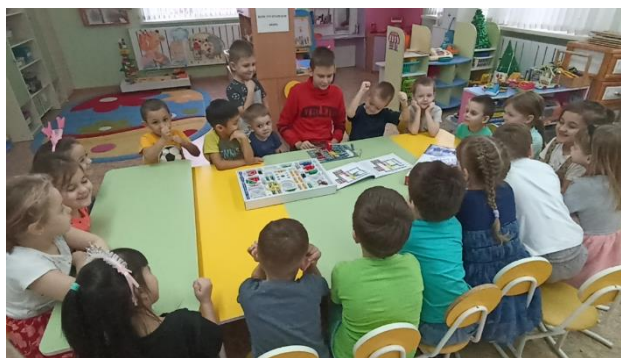
Рисунок 7 – знакомство с электронным конструктором "Знаток"

С введением инновационной программы у нас появилась нетрадиционная форма взаимодействия с родителями. При изучении тем технической направленности, когда мы испытываем трудности, мы обращаемся за помощью к родителям, которые нам идут навстречу. А иногда нам помогают старшие братья и сёстры наших воспитанников, которые посещают "Робототехнику" в Станции Юных Техников, и в последствии являются постоянными консультантами наших детей.