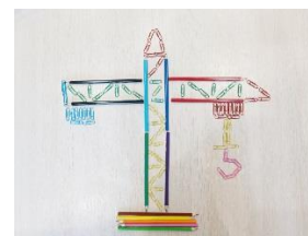
Рисунок 8,9,10 – совместная работа родителей и детей (часы, самолёт, подъемный кран)