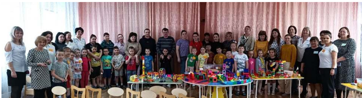
Рисунок 14 – "Школа семейного конструирования"

Итогом совместной деятельности с родителями стал семинар-практикум в форме "Школы семейного конструирования". На данное мероприятие были приглашены воспитатели ДОО г. Красноярска, родители и дети. Организованная командная работа взрослых и детей позволила создать различные объекты в результате чего получился замечательный "Парк аттракционов".